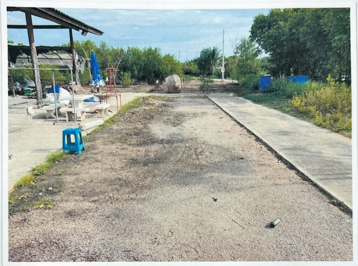
สนามกีฬา ตำบลบางจะเกร็ง