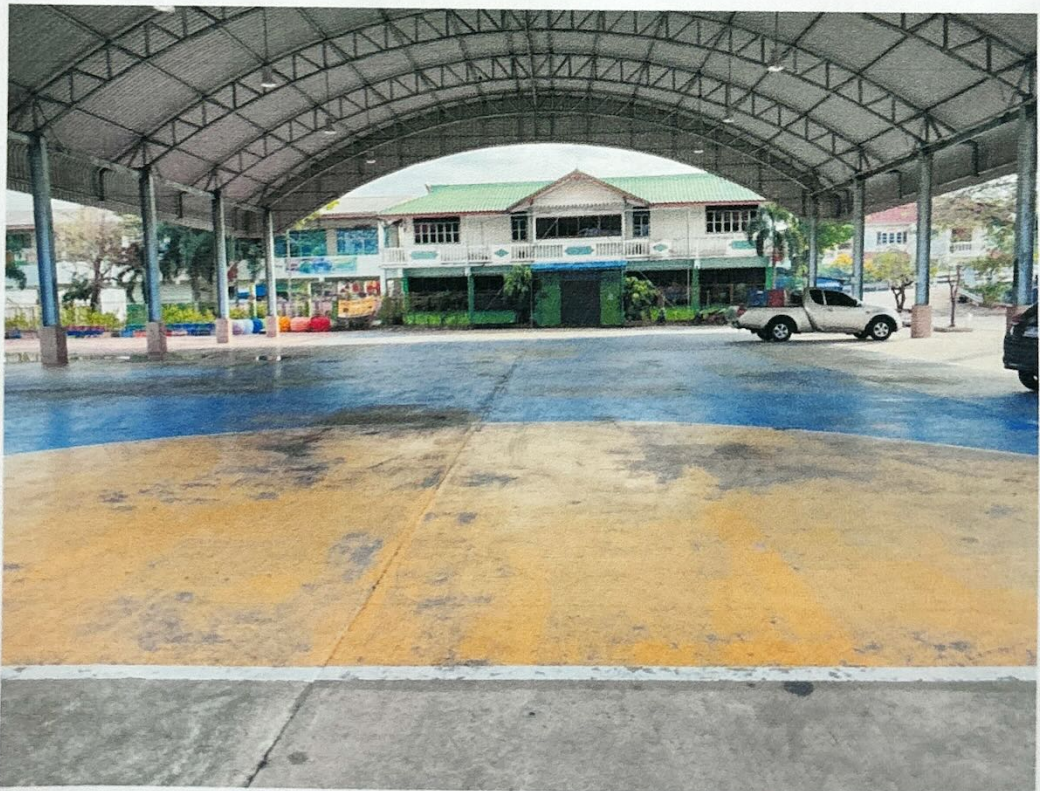
สนามฟุตบอล หมู่ที่ ๒