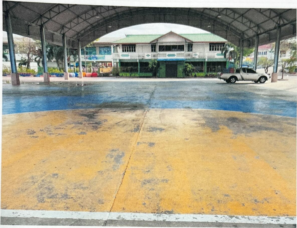
สนามกีฬา ตำบลบางจะเกร็ง