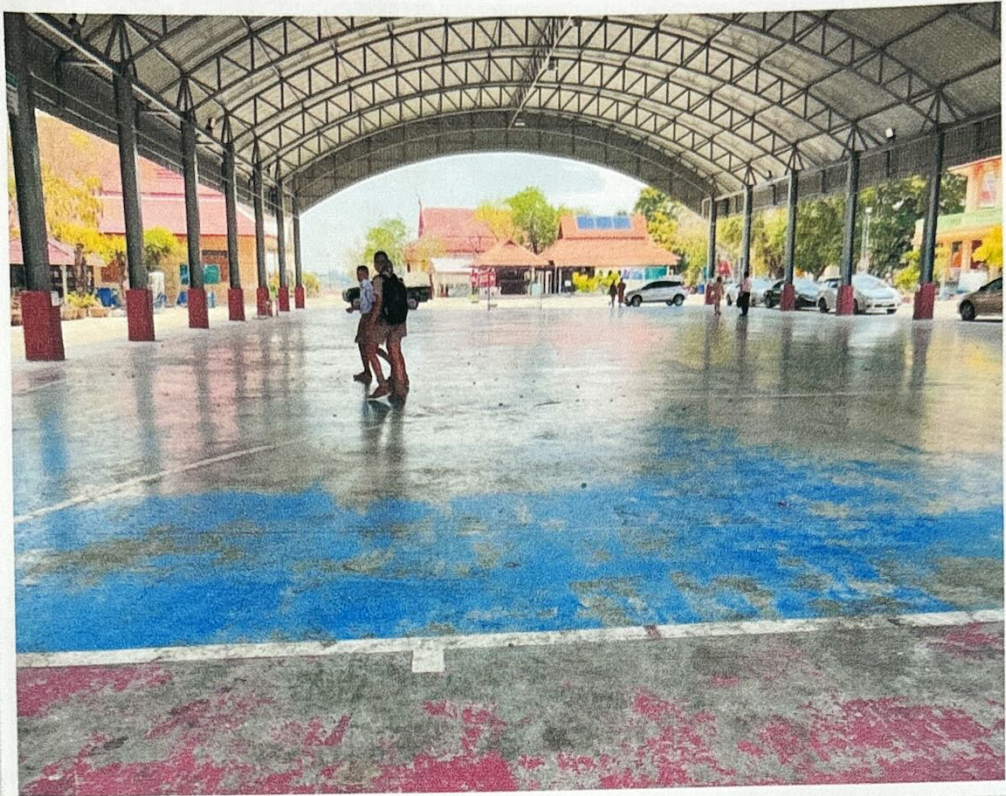
สนามกีฬา ตำบลบางจะเกร็ง