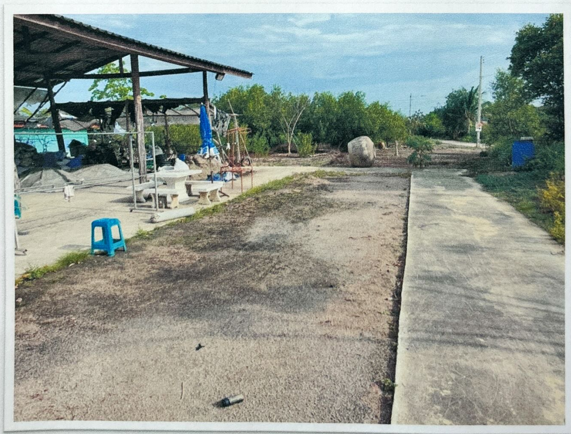
สนามเปตอง หมู่ที่ ๓