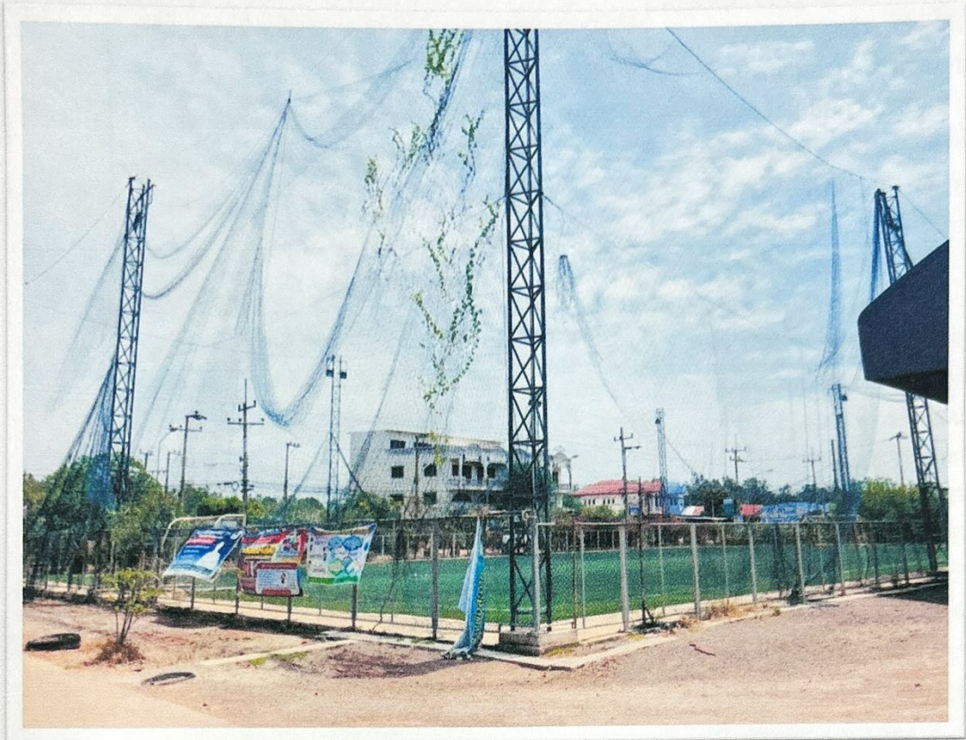
สนามกีฬา ตำบลบางจะเกร็ง