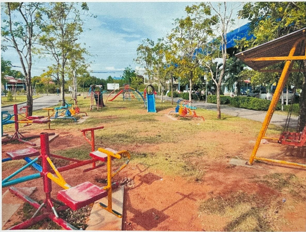
สวนสุขภาพเทศบาลตำบลบางจะเกร็ง หมู่ที่ ๒