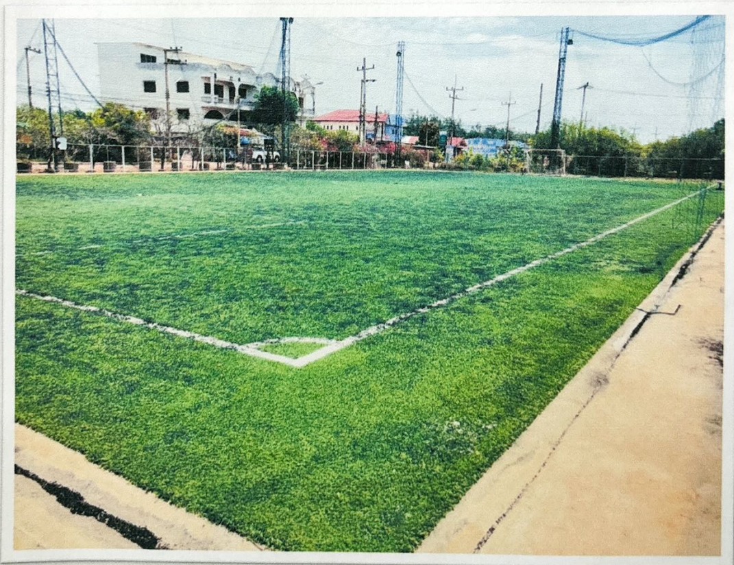
สนามฟุตบอลหญ้าเทียม หมู่ที่ ๔